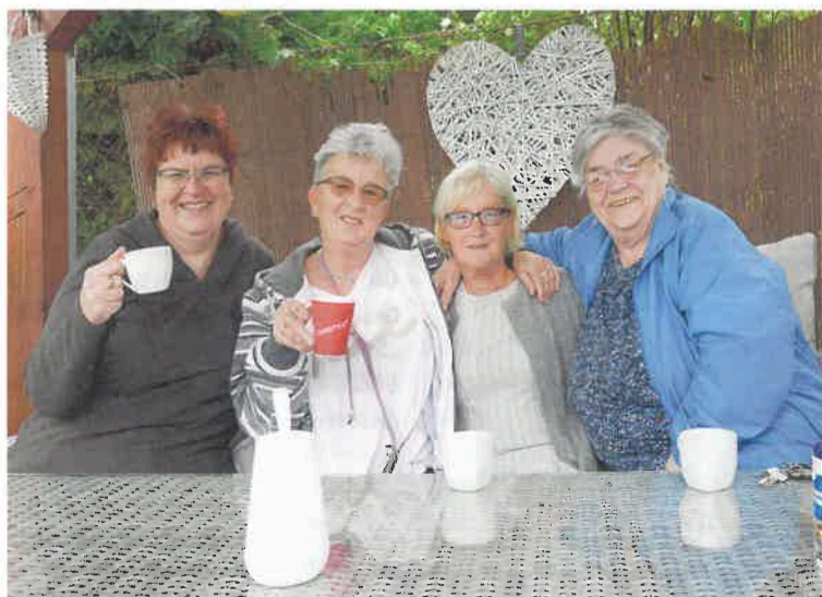
Gemeinsames Lachen hilft in traurigen Stunden.