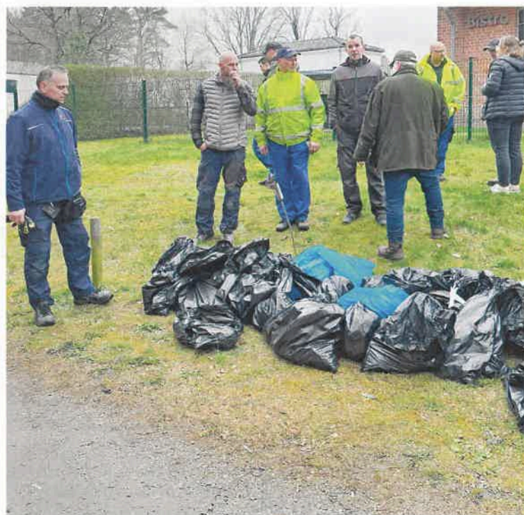
Mehrere Müllsäcke füllten die Mitarbeiter der GEWO.

bis zum Exin. Unglaublich, was die Mitarbeitenden alles gefunden haben – Bauschutt, Flaschen, Verpackungen und Kunststoffrohre. Zur Stärkung gab es danach Bratwurst und Getränke am Wasserturm.