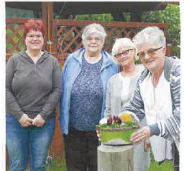
Beliebter Treffpunkt der vier Damen: der Garten.