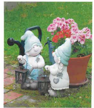
Auch die beiden Zwerge fühlen sich im Haus Nr. 10 wohl.

sammen. „Wir erlebten mit dem Schiff den Orient und Dubai, entdeckten die Türkei und Sizilien.“ Wenn sie Zuhause sind, verschönern sie das alte Haus. „Vor Kurzem haben wir den Keller gestrichen, Bilder aufgehängt und eine kleine Sitzecke hingestellt.“ Auch wenn die Zimmertüren knarren, die Waschküche eine Verjüngungskur bräuchte und die Stufen ausgetreten sind, die vier Bewohnerinnen lieben ihr altes Haus. „Es sind unsere vier Wände, die uns Geborgenheit schenken, uns beschützen und mit denen uns so viele schöne Erinnerungen verbinden.“