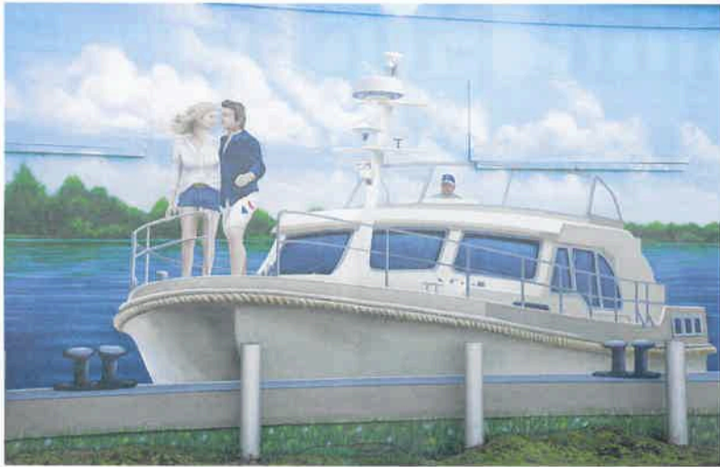
Gelungene Graffitis machen Zehdenick bunter und schöner.

Richtig, sie liegt in der Marina Zehdenick. Sicher verzurrt kann das Pärchen nun im Restaurant „Akropolis“ griechische Spezialitäten schlemmen und dabei auf der Terrasse den herrlichen Sonnenuntergang genießen.