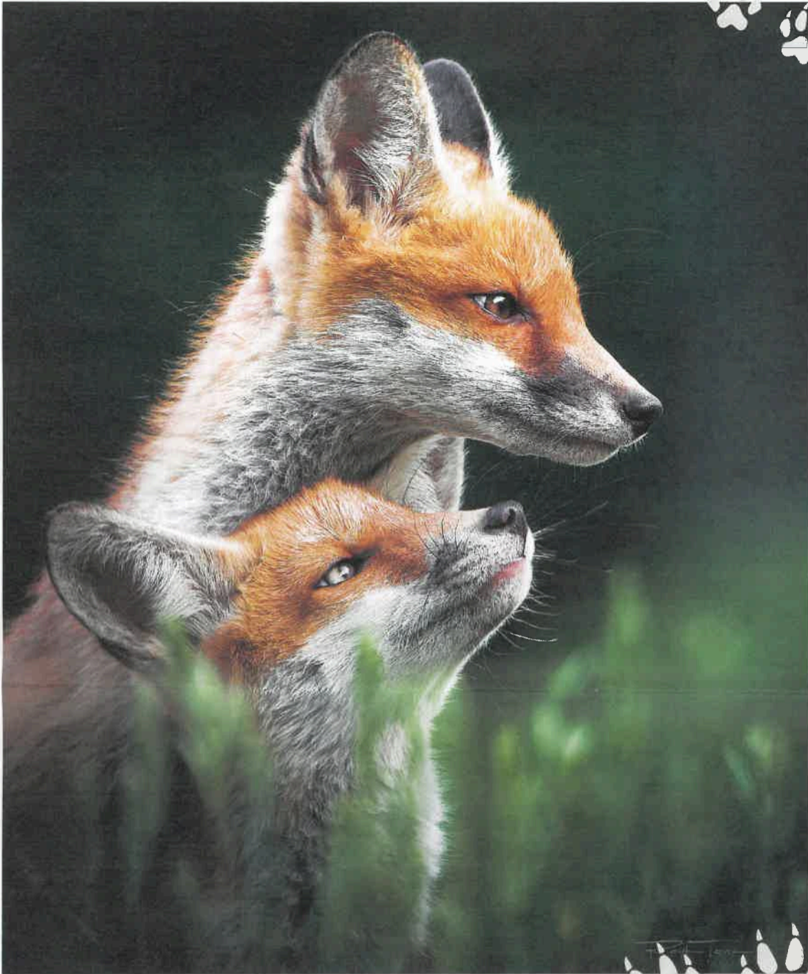
„Geschwisterliebe“ nennt der Tierfotograf die Aufnahme der Stadtfuchswelpen. Sie wurde zum „Tierfoto des Sommers 2023“ gekürt.

Da war der gelernte Fliesenleger jeden Tag bei den Stadtfüchsen. Vor der Arbeit ab früh um 4.15 Uhr und nach der Arbeit bis Sonnenuntergang. „Zum Glück habe ich eine verständnisvolle Frau“, sagt der gebürtige Berliner, der vor vier Jahren zu seiner Frau nach Potsdam zog. Er war dabei, als die Welpen erste Erkundungen vor dem Fuchsbau unternahmen, wie sie morgens auf die Rückkehr der Fähe warteten, die nachts auf Beutezug geht. Manchmal ging er nach stundenlangem Warten leer aus, ein anderes Mal war alles perfekt. Bis eines Tages im Juni der Fuchsbau verlassen war – die jungen Stadtfüchse waren flügge geworden und gingen fortan ihrer eigenen Wege. „Ich bin noch tagelang hin, aber sie waren weg!“ Was bleibt, sind die Fotos der Stadtfüchse, die er wie alle anderen Tieraufnahmen auf Instagram