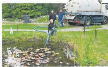
Stadtwerker beim Absaugen des Teichs.

Abwasserbereich führen mit ihrem großen Grubenentsorgungslaster in die Friedhofstraße 28 und pumpen den Schlamm ab. Danach wurde das Becken gesäubert. Dann hat die AWO den Teich wieder neu angelegt – zur Freude der Bewohnerinnen und Bewohner.