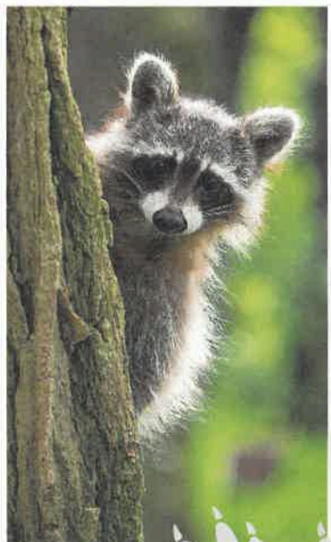
Porträt von einem Waschbären, der neugierig hinter dem Baumstamm hervorlugt.

Alle Tierporträts finden sich auf Instagram unter @potsdamoutside.