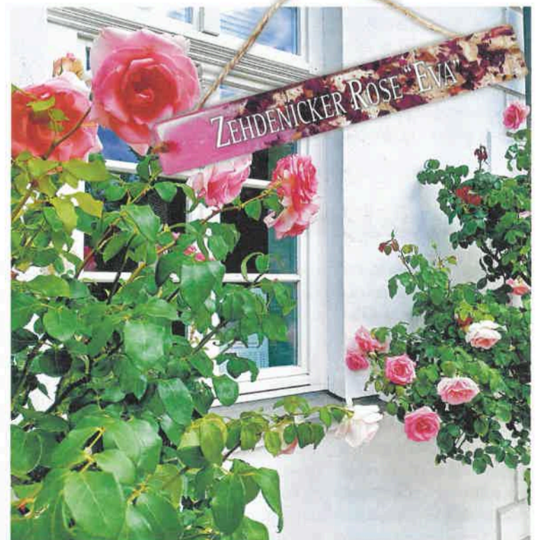
Die Zehdenicker Rosen brauchen Pflege, machen Sie mit!