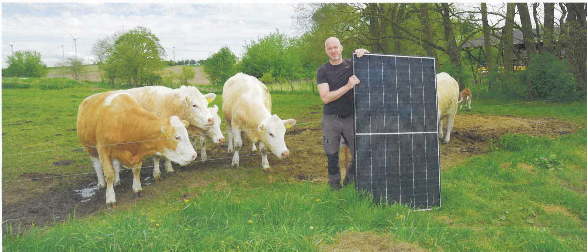
Spannung bei den Bergsdorfer Wiesenrindern. Auf ihrem Hof gibt es jetzt auch Photovoltaik auf dem Dach.