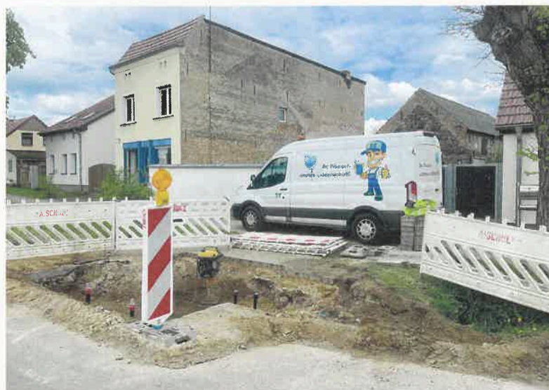
Die Transporter der Stadtwerke sind an vielen Orten unterwegs.

Sie werden ab sofort nur noch auf unserer Internetseite veröffentlicht unter: www.stadtwerke-zehdenick.de/privatkunden/abwasser/abfuhrtermine-grubenentleerung/