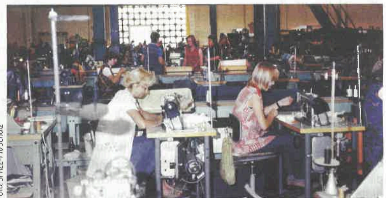
Einblick in den Produktionsalltag: In der einstigen Schwedter Schuhfabrik arbeiteten bis zur politischen Wende mehr als 500 Menschen.

Erst Tabak, Seife, Papier, später wurden hier Schuhe produziert, die erdölverarbeitende Industrie zog ein – allein in den letzten 150 Jahren hat sich die kleine Stadt an der Oder unzählige Male neu erfunden. Ein virtueller Stadtpaziergang zeigt, wie sich Schwedt nach wirtschaftlichen und politischen Umbrüchen verändert hat.