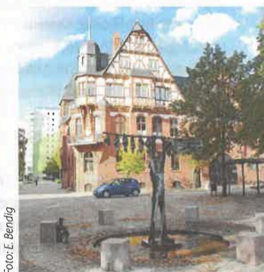
Schönstes Haus am Platz: die ehemalige Hahnseife-Fabrik.