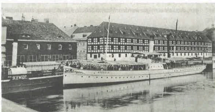
Das Bollwerk: Früher legten hier Schiffe an, Fabriken säumten das Ufer. Heute lädt an gleicher Stelle die Promenade zum Flanieren am Wasser ein.