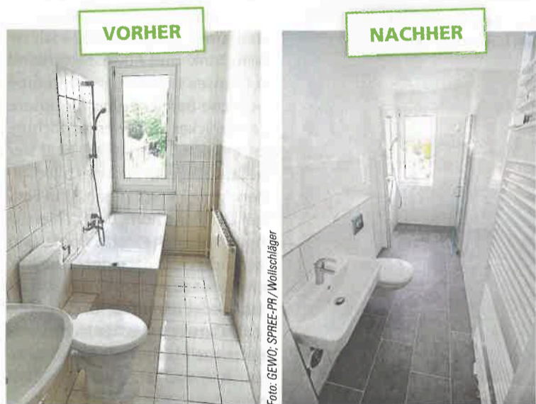
Die Bäder vor (li.) und nach MOD SÜD 2.0. Highlight ist die bodenebene Dusche mit viel Platz. Auch die Waschmaschine passt ins neue Badezimmer.

Für die GEWO ist die jetzt angelaufene Modernisierungsphase in Zehdenick-Süd die konsequente Fortsetzung der äußeren Verschönerungen in der Straße des Friedens, der Marianne-Grunthal-Straße und im Grünen Weg.