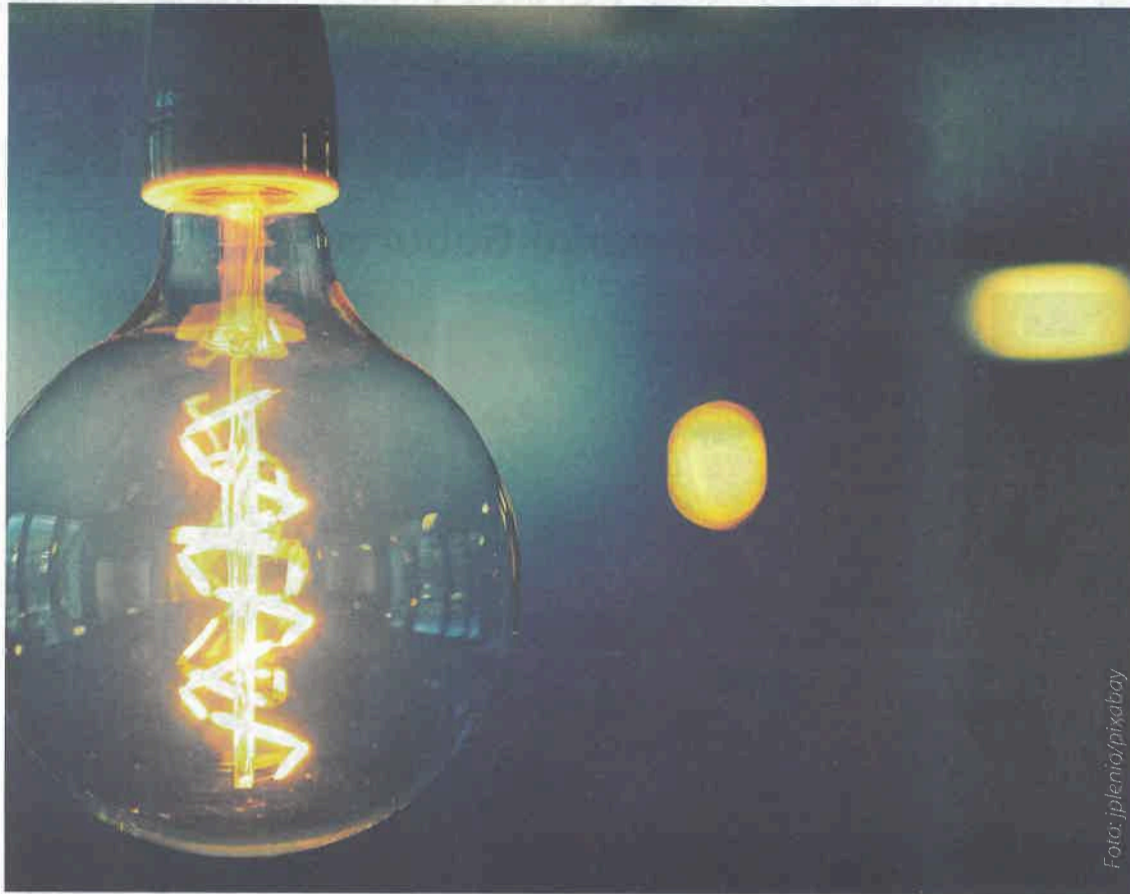
Bei der aktuellen Lage sollte man in ungenutzten Räumen häufiger mal das Licht auslassen. Energieversorger haben leider nur einen geringen Einfluss auf den Preis. Beim Strom ist es ein Anteil von 20 Prozent, beim Gas knapp über 45 Prozent, den sie kalkulieren können. Die restliche Summe setzt sich aus Steuern und Abgaben zusammen.

Die Zertifikate für den Ausstoß des Klimagases CO 2 sind deutlich teurer geworden. Seit Januar 2021