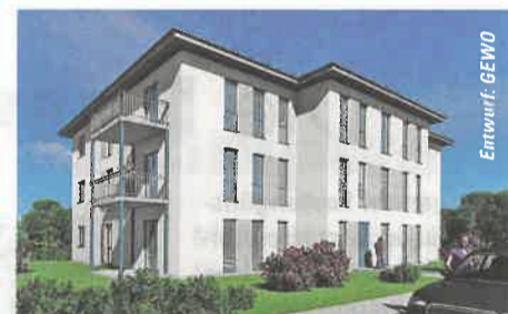
Ein Hingucker: das neue GEWO-Schmuckstück.

Die städtische Wohnungsgesellschaft hat ein gutes Händchen für Neubau- und Sanierungsprojekte. Aktuelles Beispiel: die Philipp-Müller-Straße 35.