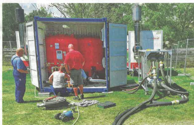
Neuland für die Stadtwerke: Ein mobiles Heizwerk übernahm zeitweise die Wärmeversorgung.

Mobiles Heizwerk Die Fernwärmehauptleitung verläuft auch unterm Gelände der Havelland-