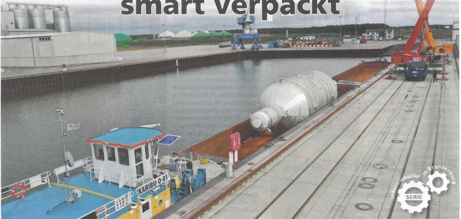
Der Schwedter Hafen: 2001 in Betrieb genommen, legen hier vor allem Kapitäne mit großen Schiffen an. Bis zu 400 sind es jährlich, die das „Tor zur Ostsee“ nutzen.